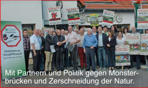
Mit Partnern und Politik gegen Monsterbrücken und Zerschneidung der Natur.